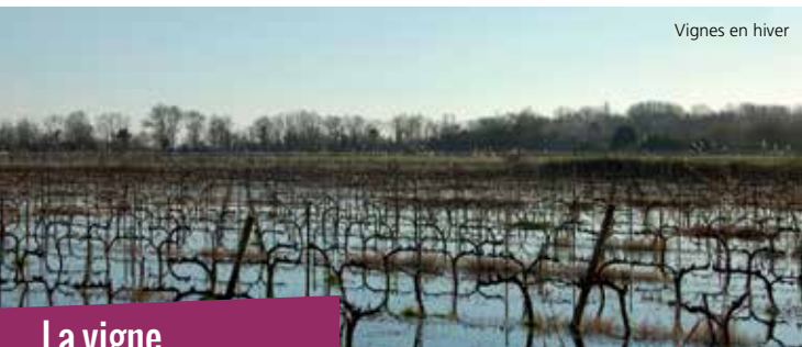
Vignes en hiver

Le chemin de Saint-Jacques de Compostelle rappelle l'apôtre Jacques (présent durant la vie de Jésus) qui aurait été décapité vers 41-44. Ce n'est que sous le règne de Charlemagne et d'Alphonse II le Chaste (759-842) que son tombeau est découvert. De nombreux fidèles lui rendent hommage sur cette route. La Via Tolosana au départ d'Arles est l'un des quatre itinéraires vers le tombeau de Saint-Jacques.