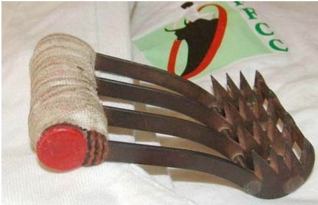
crochet de rasetteur