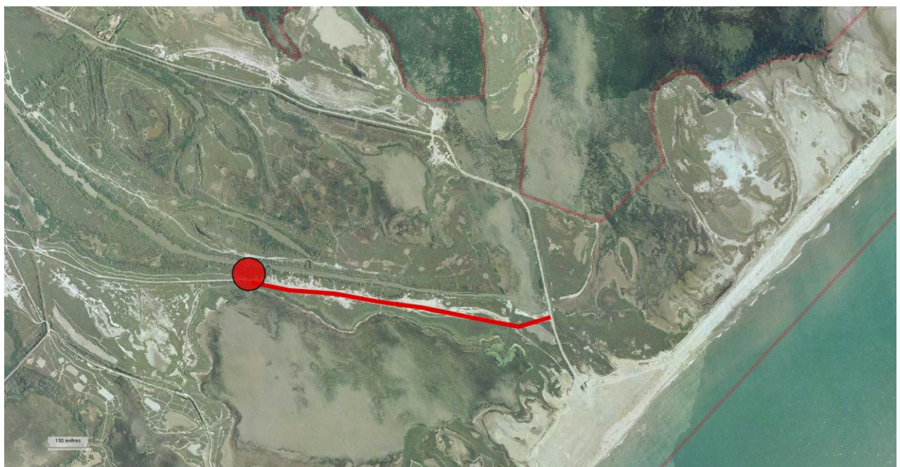
Fig. 2. Accès au chantier à partir de la départementale