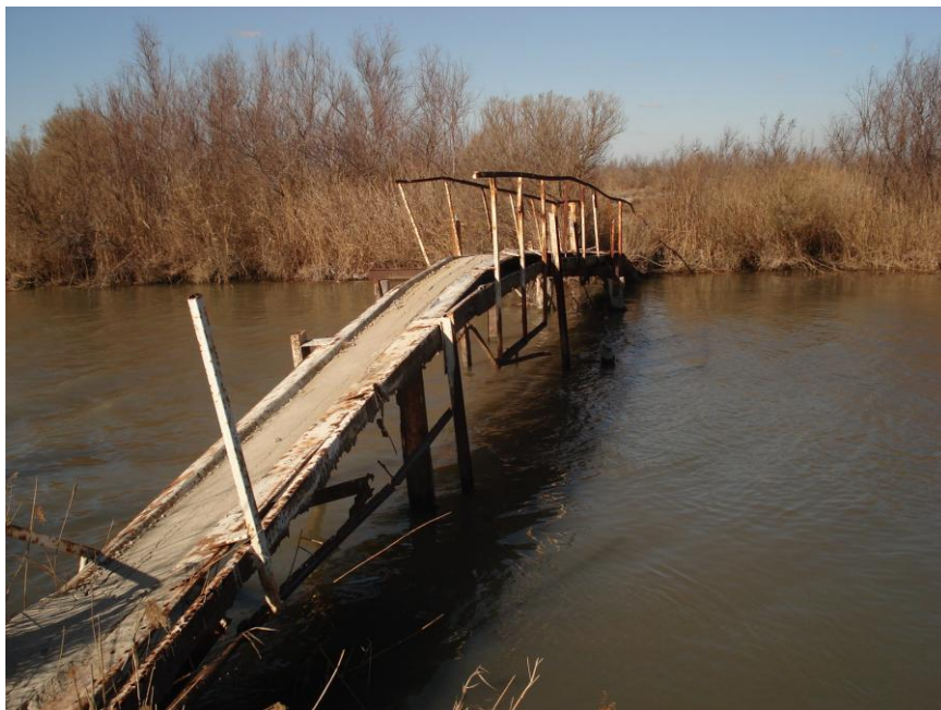
Fig 3. Ouvrage en place à démonter et évacuer

L'ensemble des matériaux issu du démantèlement sera évacué immédiatement dans une décharge agréée. Une copie du reçu de mise en dépôt sera fournie au maître d'ouvrage.