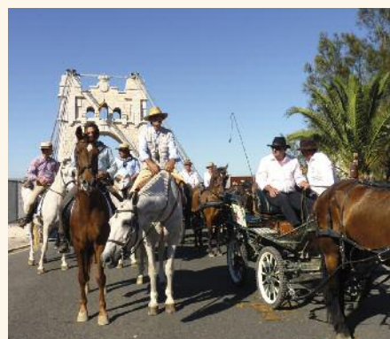
L'arrivée des cavaliers et attelages camarguais et andalous sur le pont d'entrée de la ville d'Amposta.

Contact : Laure Bou, responsable du pôle « Eau et développement local », tél. 04 90 97 10 40