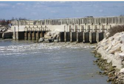
Pertuis de la Fourcade.

Plus d'informations dans un prochain Visages de Camargue et bientôt sur le site Internet du Parc !