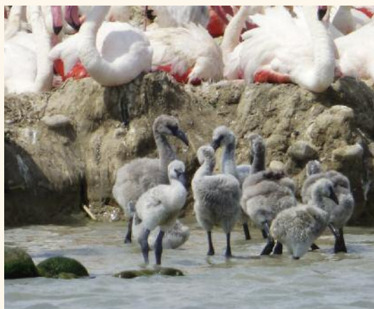
Poussins de flamants roses

C'est une belle année pour la reproduction des flamants roses sur l'étang du Fangassier. Plus de 14 000 couples se sont installés, ils ont tenu bon malgré le mistral et forment une immense tache rose caractéristique et magnifique, visible à partir de la digue des enfores de la Vignole, au bout de la route du Fangassier (Chemin communal 135). Les premiers poussins sont là depuis quelques jours. Si vous souhaitez découvrir le site, vous pouvez contacter l'office de tourisme de Salin-de-Giraud pour une visite accompagnée par le bureau des guides naturalistes.