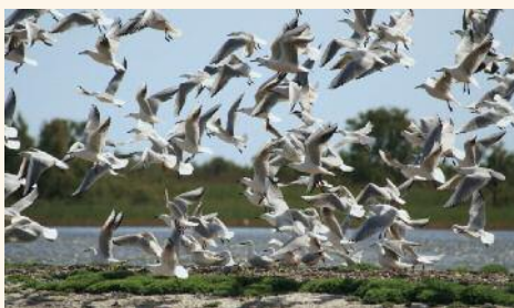
Une Sterne pierregarin au milieu des Goéland railleur, © E. Vialet

Les laro-limicoles sont des oiseaux emblématiques du littoral méditerranéen. Sternes, Goélands, Mouettes et Avocettes élégantes sont largement menacés, principalement par la perte des zones de nidification due aux dérangements humains (surfréquentation du littoral). Sur le domaine de la Palissade, la mise en protection a permis la réussite de la nidification en 2008 d'une trentaine de couples de Sterne. Grâce à ce premier succès, le site a bénéficié en 2009 du « Plan d'actions pour la sauvegarde des oiseaux côtiers de Méditerranée » porté par la