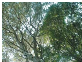
taille de formation d'un arbre en cèpée

Pour compléter cette action, il est envisagé l'édition d'un livret technique à destination des habitants pour des conseils, dans le choix des espèces, de gestion et d'entretien des arbres. Par ailleurs, le Parc expérimente actuellement la culture de graines issues d'espèces végétales sauvages indigènes en Camargue.