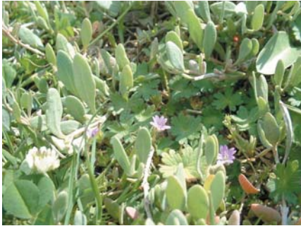
(1) : marquées par l'action du sel (2) : se dit de plantes dont les feuilles épaisses sont gorgées d'eau pour lutter contre la sécheresse

L'obione ( Halimione portulacoides ) est une plante commune de basse et moyenne Camargue évoluant sous forme de coussinets, en bordure des étangs et sur les parties hautes des sansouïres, dans des zones moins halophiles(1) et où les sols sont plus riches en nitrates du fait de la décomposition des autres végétaux. Consommées confites dans le vinaigre dans l'Ouest de la France, les pousses crassulentes (2) d'Obione font aussi partie du menu préféré des taureaux notamment à l'automne. Des recherches sont actuellement menées en Camargue, pour étudier les possibilités de valorisation agricole de cette plante.