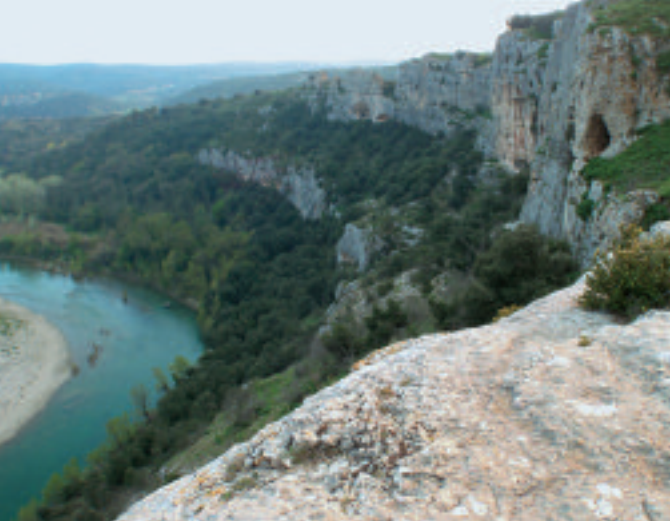
Gorges du Gardon "Le castelas".