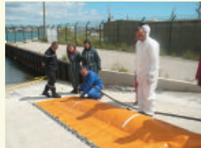
Rangement d'un barrage flottant.

définition de zones prioritaires et de zones de stockage, organisation d'une formation du CEDRE en Camargue...etc.).