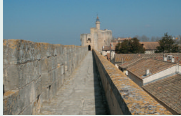
Les remparts d'Aigues-Mortes.

6- Trois d'entre elles ont déjà bénéficié d'un programme LIFE en 2004-2008, le Rhinolophus euryale, le Myotis capaccinii et le Miniopterus schreibersii.