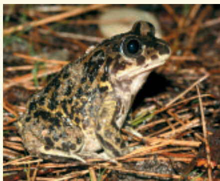
Le Pélobate cultripède fréquente ponctuellement des marais temporaires de ce site NATURA 2000.

Contact : Stéphan Arnassant 04 90 97 10 40