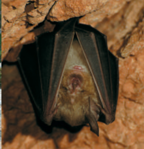
© Raphaël SANE – Groupe chiroptères de Provence.