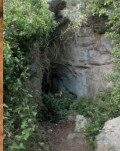
Entrée d'une cavité à chauves-souris.

afin de repérer la présence de ces 2 espèces. Cela s'effectuera de 3 façons : par les agents du syndicat, par des équipes comprenant des bénévoles, et par « Anabat® », enregistreur d'ultrasons efficace pour les grandes grottes. Nous réaliserons un suivi des populations des colonies majeures ainsi découvertes. Ce programme offre l'opportunité de travailler sur un réseau élargi. Il s'agit de savoir par exemple si la diminution du nombre de chauves-souris est due à un problème local ou plus global. » L'analyse génétique du guano, effectuée par le