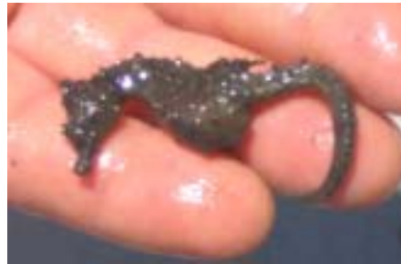
figure sur la liste rouge de l'IUCN et la raie étoilée ( Raja cf. asterias ), protégé sur le territoire français. Les communautés macrobenthiques sont structurées en fonction de leur composante spatiale (profondeur et orientation) tandis que pour les poissons, les variations saisonnières sont prépondérantes. De plus, le rôle de nurserie du golfe de Beauduc a été mis en valeur avec notamment le fort recrutement des juvéniles de poissons durant l'été. Des propositions d'études complémentaires et de suivi ont été faites.

Les conclusions des travaux menés cette année par le Centre d'Océanologie de Marseille sont maintenant consultables sur le site du Parc dans le rapport nommé : « Inventaire de la macrofaune benthique du golfe de Beauduc en vue de l'élaboration d'un protocole de suivi biologique du littoral marin du Parc de Camargue ». Les échantillonnages réalisés cette année (de 6 à 20 mètres de profondeur) à l'aide d'un chalut à perche et d'une drague, sur deux saisons (printemps et été) et deux transects (est et ouest du golfe de Beauduc) ont permis d'identifier 140 espèces de poissons et d'invertébrés dont l'hippocampe à museau court ( Hippocampus hippocampus , espèce emblématique) qui