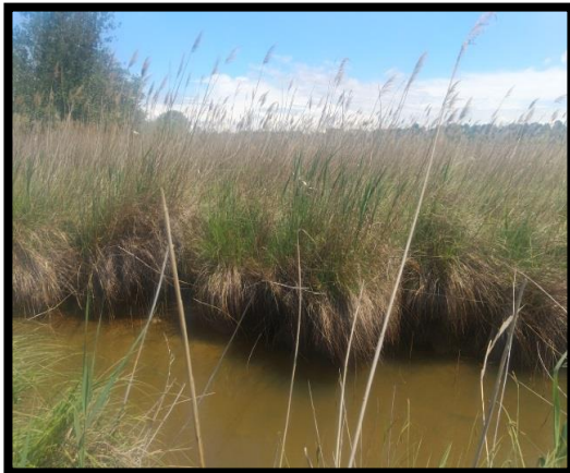
Figure 1 : Roselière au marais de Beauchamp

gestionnaires du site (CEN PACA, Chasseurs, manadier). Dans le même temps, le Syndicat intercommunal du Vigueirat et du canal de la vallée des Baux (SIVVB) qui avait pour projet de réaliser une étude hydraulique préalable à des travaux de restauration de berges sur le canal de la vallée des Baux, a souhaité mobiliser des partenariats pour une meilleure prise en compte du patrimoine naturel