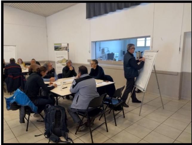
Figure 5 : atelier de concertation

fédérer l'ensemble des acteurs qui pourraient contribuer à ce projet, à commencer par les partenaires techniques et financiers en vue de la réalisation d'une étude préalable qui permettra de choisir un scénario de restauration. Lors du Comité de pilotage en novembre 2023 organisé chez les propriétaires au domaine de Joyeuse Garde, le Parc naturel régional des Alpilles s'est proposé pour porter le projet de restauration appuyé par un ensemble de partenaires (Tour du valat, A ROCHA, CEN PACA, SIVVB, PNRC). Le démarrage de l'étude est prévu pour 2024.