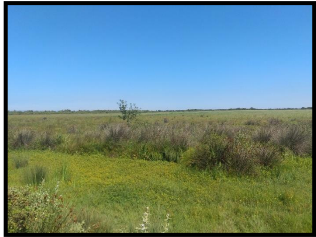
Figure 3 : Cladiaie

En 2023, 24 exploitations ont été accompagnées par l'animateur Natura 2000 en vue de la contractualisation de mesures agro-environnementales et climatiques (MAEC). Parmi ceux-ci, 21 agriculteurs ont contractualisé des MAEC entre Crau Camargue et Alpilles dont 18 sur le territoire du Parc de Camargue.