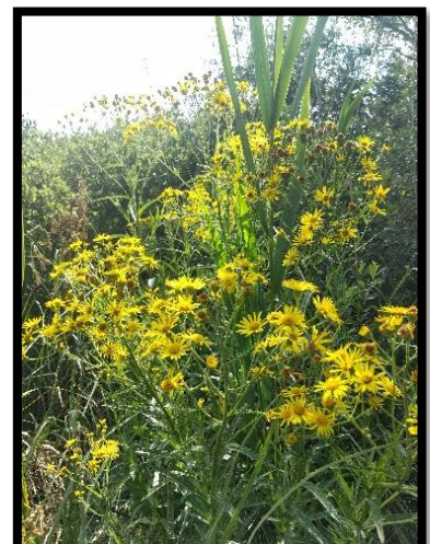
Figure 6 : Sénéçon des marais

Suite à une visite du conservatoire botanique national de Méditerranée en juin 2023 sur les marais de Beauchamp, la station de Sénéçon des Marais historiquement connue a été confirmée comme étant la dernière station de la Région Provence-Alpes-Côte-d'Azur. L'espèce qui affectionne les milieux ouverts est menacée de disparition sur le secteur par la fermeture du milieu notamment par la colonisation par les frênes. Le Parc de Camargue a sollicité l'intervention du CEN PACA pour la mise en place d'un chantier Eco-TIG (travaux d'intérêt général). Ces travaux réalisés en septembre 2023 en partenariat avec le CEN PACA, la commune d'Arles et le groupement cynégétique arlésien a permis, par des opérations d'annelage des arbres et de débroussaillage, de restaurer un milieu ouvert davantage propice à l'expression du sénéçon des marais.