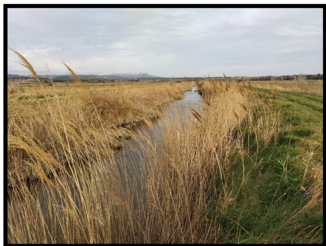
Figure 4 : domaine de Joyeuse Garde

Un couple de propriétaire de la vallée des Baux, envisage un projet de restauration écologique sur un polder drainé par l'activité agricole depuis plus de 50 ans. Le propriétaire a contacté le Parc des Alpilles et le Parc de Camargue pour avancer sur son projet, et plusieurs échanges et visites de terrain ont eu lieu. Le Parc de Camargue a contacté la Tour du Valat qui confirme l'intérêt de porter un projet pionnier de restauration écologique sur ce secteur d'anciennes tourbières méditerranéennes. Par ailleurs, le Parc de