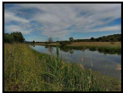
Figure 2 : Canal de la vallée des Baux

Il s'agit d'un projet qui a émané de la volonté de plusieurs acteurs de concilier les activités socio-économiques, les enjeux de risques inondations et de préservation du patrimoine naturels. Le Parc de Camargue en 2022, en partenariat avec le CEN PACA, a proposé un projet d'étude hydraulique des marais de Beauchamp qui visait à concilier les enjeux cités précédemment afin d'aboutir à une gestion concertée entre les différents