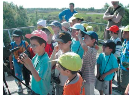
Animation au bord du Vaccarès avant l'aller en Brière...

Les deux Parcs naturels régionaux et les enseignants ont en effet mis au point un programme d'éducation au territoire se déroulant sur deux ans. Après avoir activement étudié les composantes de leur territoire, les élèves de Gageron et d'Albaron vont se rendre en Brière au mois d'octobre. Pendant une semaine, ils vont découvrir et étudier ce qui fait la spécificité de cette région et quels sont ses