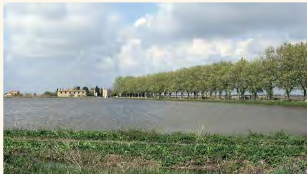
Mas du Juge.

Chargée de mission architecture, urbanisme, paysage et énergie, tél. 04 90 97 10 40, archi.paysage@parc-camargue.fr