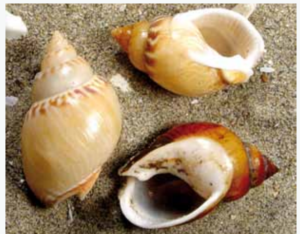
Nasse changeante, une pêche en développement

Par ailleurs, 2 espèces d'intérêt communautaire fréquentent ponctuellement la zone : la tortue caouanne et le grand dauphin. Les tortues marines bénéficient sur la commune du Grau-du-Roi d'un centre de soins pour tortues marines qui intervient suite à des échouages ou captures (CESTMED). Un autre animal emblématique y est observé régulièrement, notamment à proximité des enrochements de la digue de Port Camargue : l'hippocampe à museau court.