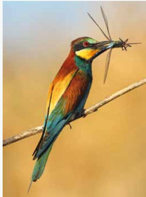
Guépier d'europe