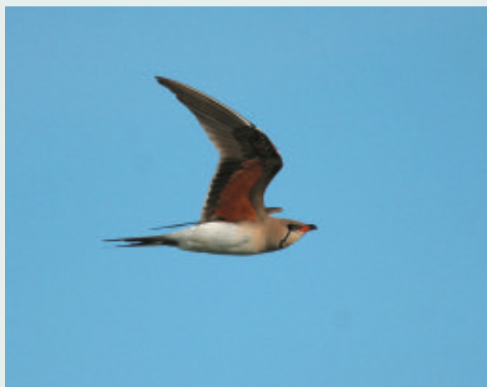
Glaréole à collier.

Ce site qui épouse le lit du fleuve s'étend de Donzère à l'embouchure du grand Rhône (150 km). Les diagnostics écologique et socio-économique vont y être lancés en 2011. Le périmètre est en lui-même le témoin d'un des forts enjeux : la continuité longitudinale le long du Rhône (effet «corridor») au profit de nombreuses espèces en particulier des poissons migrateurs (alose feinte, anguille, lamproie marine...). Mais d'autres enjeux à préciser y sont liés à l'existence d'espèces et de milieux contrastés (montagnards et méditerranéens), de bras morts, berges marécageuses et forêts riveraines (qualité de la flore aquatique, présence du castor, population de chauve-souris, tortue Cistude...).