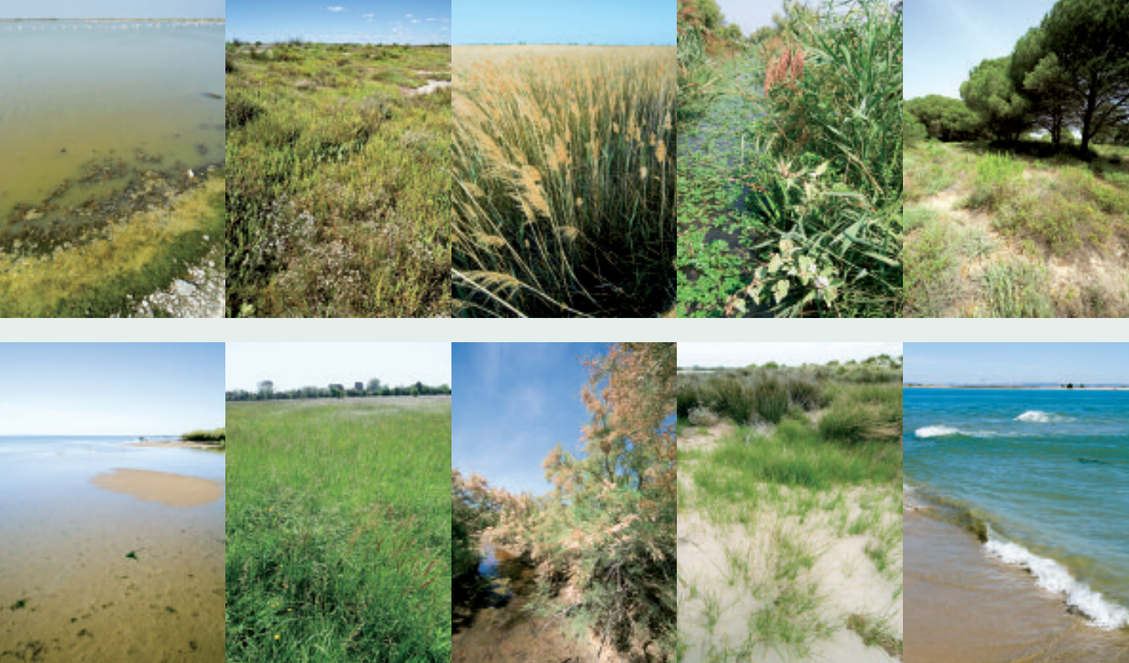
Quelques habitats Natura 2000 : lagunes, sansouïres, roselières, plages et dunes, boisements de tamaris...