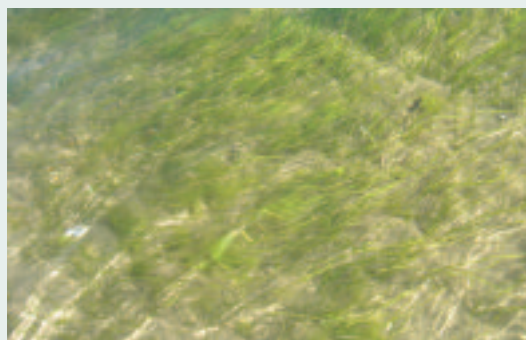
Herbier à zoostère.

Sur ce site qui couvre l'île de Camargue et le littoral marin (3 milles pour la directive «Habitats» et 12 milles pour la directive «Oiseaux»), les enjeux de conservation sont déjà validés ( Visages de Camargue , juillet-août 2008) et le cahier des charges des futurs contrats en cours de validation. Vingt mesures sont proposées. Elles visent à l'amélioration de l'état de conservation de milieux exploités par des espèces remarquables (chauve-souris, glaréole, sternes, mouettes et petits échassiers, tortue cistude...) ou à la conservation d'habitats remarquables en eux-mêmes (sansouires, lagunes, mares temporaires, pelouses, ...). Au Parc ornithologique de Pont de Gau, Benjamin Vollot voit dans ce panel de nombreux outils intéressants : « Jusqu'ici, nous avons beaucoup investi sur nos fonds propres notamment pour la création d'îlots de reproduction de mouettes, sternes et petits échassiers. Les contrats Natura