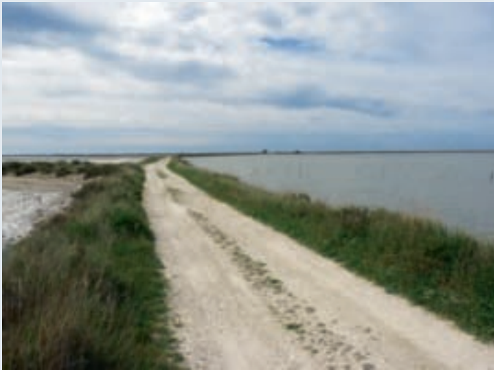
Digue construite dans les années 1960 pour la production de sel entre le Tampan et le Galabert. En cours d'aménagement pour permettre les échanges d'eau, de sel et de la faune aquatique.

œuvre cette gestion, avec quels moyens, humains, matériels... » explique François Roberi de l'Agence de l'eau. Les étangs situés à l'ouest du vieux Rhône ont été intégrés à l'exploitation salicole de Salin-de-Giraud et isolés par des digues des entrées marines et des bassins versants. La fin des activités qui signe aussi l'arrêt de la station de pompage d'eau de mer de Beauduc, les prive aujourd'hui de la circulation des eaux. Des études menées dans le cadre du contrat de delta doivent définir les orientations d'une nouvelle gestion du système Fangassier-Galabert-Beauduc, garantissant des échanges hydrobiologiques jusqu'à la mer, ce qui favoriserait aussi le rôle de frayère des étangs. La