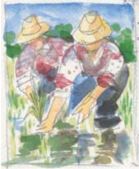
Dessin : Henri-Paul Pasquier

Céréale exotique et sacrée, elle ne laisse pas insensible et passionne les hommes qui la cultivent.