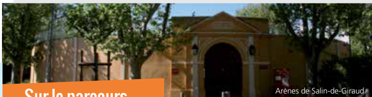
Arènes de Salin-de-Giraud

La traversée du Rhône fut possible dès 1933 grâce à un premier bac à treuil. Mais ce dernier fut détruit pendant la seconde guerre mondiale. Le nouveau bac diesel n'entra en action qu'en 1955. Un bac ferroviaire pour le transport du sel a été créé en 1957. Le quatrième et le cinquième bac de Barcarin furent installés en 1987 et 2012 permettant la traversée actuelle d'une rive à l'autre du fleuve.