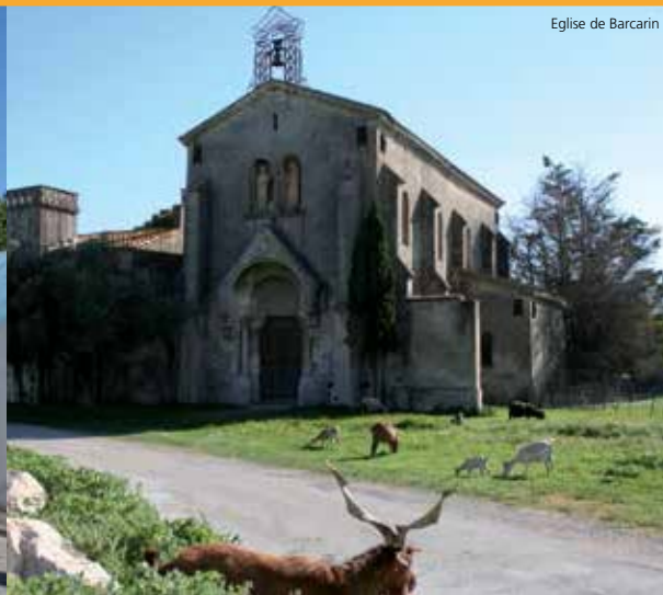
Eglise de Barcarin