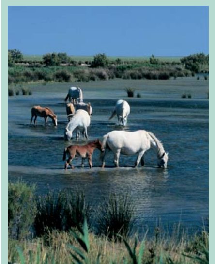
Élevé en extensif, le cheval de race Camargue, dans son berceau de race, participe au maintien des espaces naturels. Cheval de travail pour la conduite des travaux, il est aussi très apprécié pour ses talents.