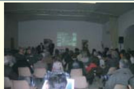
Réunion publique de Mas-Thibert, 12 janvier 2007

Parallèlement des Commissions géographiques se sont constituées à Salin-de-Giraud et à Mas-Thibert pour travailler sur les orientations de la nouvelle charte du Parc à l'échelle de ces villages.