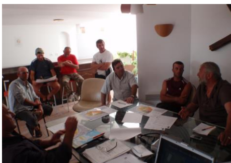
Concertation avec pêcheurs professionnels (PNRC)

Suite à la demande des pêcheurs professionnels en 2004, le Parc a travaillé à la création d'une réserve marine dans le golfe de Beauduc. L'objectif principal est de restaurer cette zone de nurserie pour poissons plats après des années de passage illégal des arts traînants en créant une « zone abri » dont l'action se fera ressentir à terme bien au-delà de la réserve pour le bénéfice de la biodiversité comme de la pêche. Après plusieurs études de connaissance et de faisabilité, la concertation avec les pêcheurs professionnels et l'ensemble des acteurs concernés (2009-10) a permis d'établir les choix d'emplacement et de gestion. Associés très tôt au processus, les plaisanciers sont aussi des partenaires privilégiés pour le Parc, grâce à leurs actions de sensibilisation, leurs observations et leur contribution à la concertation.