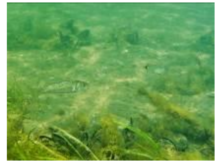
Juvéniles de loup et de sar (PNRC)

La gestion de ces sites a donné lieu à plusieurs conventions de partenariat (GIS Posidonie/M.I.O, Phares et Balises, Prud'homie de Pêche) et d'autres sont à venir (Agence des Aires marines protégées, SDIS 13...).