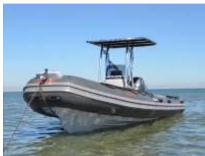
Bateau du Parc de Camargue