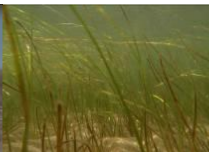
Herbier de zostères naines (PNRC)