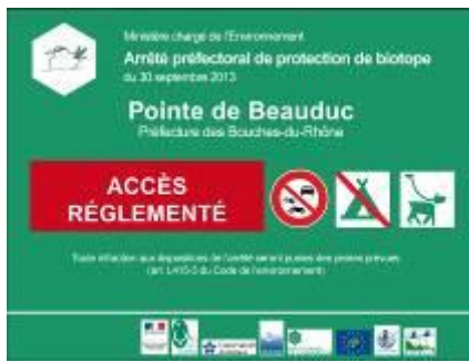
Panneau signalétique (PNRC)