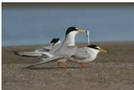
Sternes naines (Xavier Ruffray)