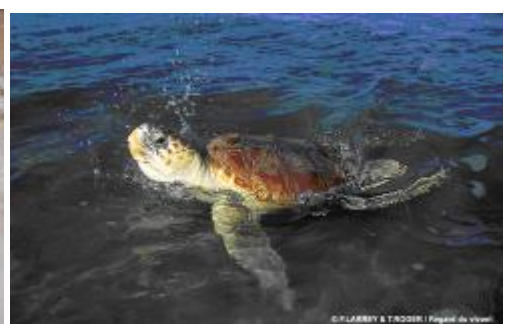
Tortue Caouanne (Regard du vivant)