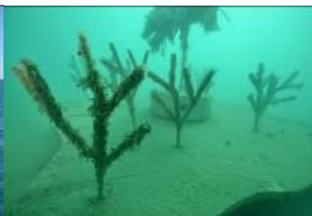
Dispositif de nurserie artificielle