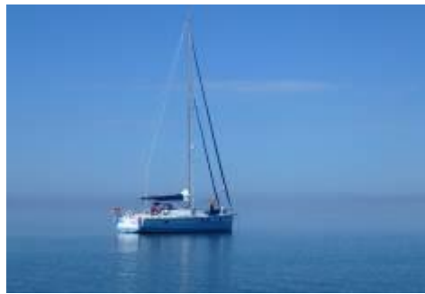
Plaisancier à Beauduc (DREAL PACA)