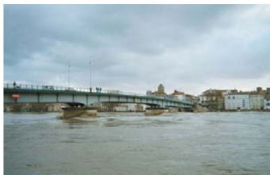
La surveillance des digues du petit Rhône (entre Albaron et le Château d'Avignon)

Dans l'urgence aussi, l'équipe du Parc de Camargue sait se mobiliser pour les habitants et les professionnels de Camargue